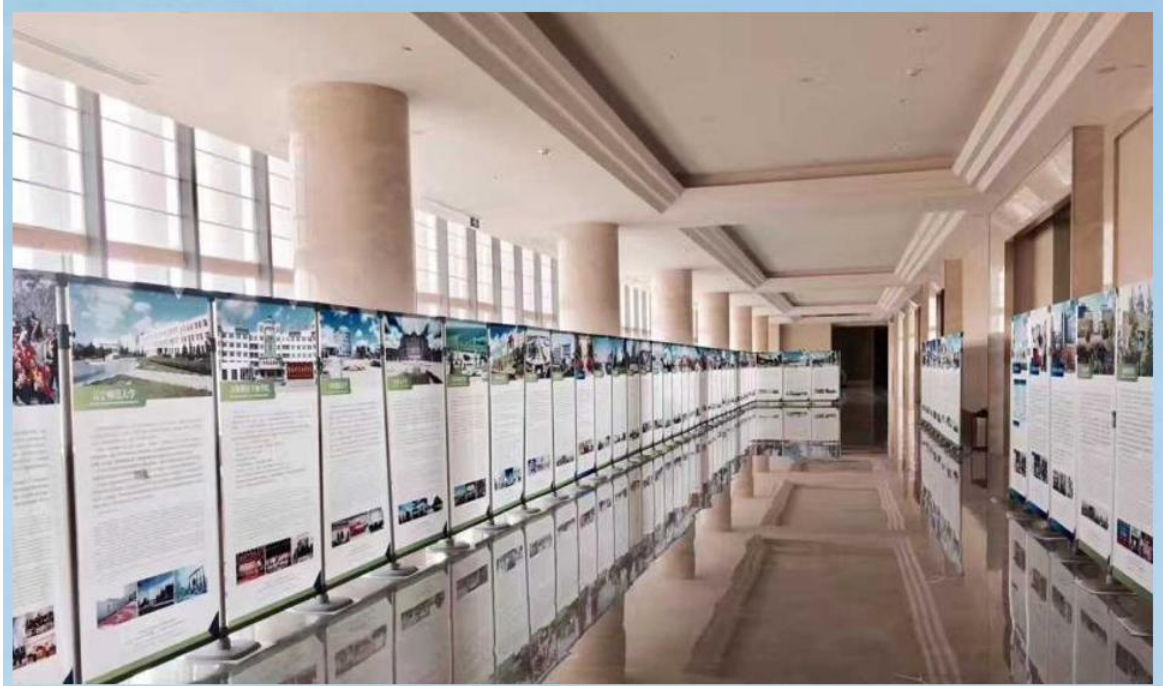
图2 商家宣传板外观示意图